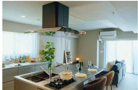
Iタイプ:リビングダイニングキッチン