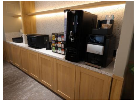
コーヒーサービス

ラウンジインテリアデザイン: ミギリデザイン合同会社(公式サイト: https://www.migiri.jp )